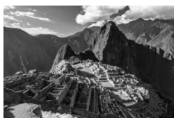
Machu Picchu, ciudadela inca

Te haré dar ropa nueva. De mi pecho el puro afecto apreciarás un día. Pero, ¿cómo has caído en desamparo? RUMI-ÑAHUI El Inca que hoy nuestra nación domina es un déspota vil, inicuo, avaro, que entre la sangre vive y la ruina, no hay perdón para nadie; no hay un cuello al que amague su demente encono; el Cuzco tiemble en brazos del degüello, y Túpac se ríe desde su alto trono. Nunca se sacia el alma destructora de ese tirano, horror del universo; es un suncho que todo lo devora, ponzoña esparce su ánimo perverso. Su depravado corazón medita una cosa, y ordena lo contrario. Solo en el mal su espíritu ejercita, y en cada hombre mira un adversario. [...] OLLANTA No te aflijas, yo te daré el empleo que te cuadre, y una tropa selecta haré que rijas. Curaré tus heridas con mi mano, y venganza obtendrás del rey funesto. Para el día del Sol, festín galano en el cuartel real tengo dispuesto.