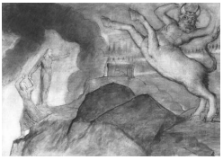
El encuentro con el Minotauro, imaginado por William Blake.