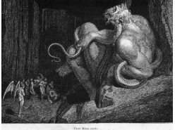
"Allí está Minos", La divina comedia (infierno, canto V, línea 4). Ilustración de Gustave Doré.