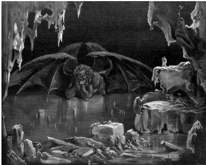
El infierno de Dante, según Gustave Doré

Actividad 1. Observa la siguiente imagen y escribe un párrafo en el que describas qué ves en ella.