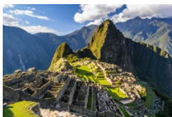
Machu Picchu, ciudadela inca