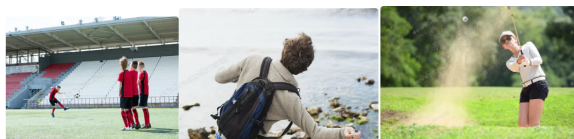
Figura 1: Ejemplos de movimiento parabólico

En la guía anterior estudiamos la relación entre magnitudes: distancia contra tiempo, velocidad contra tiempo y aceleración contra tiempo. Ahora examinaremos el movimiento más general de un objeto que se mueve a través del aire en dos dimensiones, como el lanzamiento de un tiro libre en un partido de fútbol, el rebote de una piedra sobre la superficie del agua y el golpe a una pelota de golf. Estos son ejemplos de movimiento parabólico, el cual debe estudiarse en dos dimensiones.